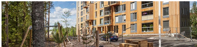
Kuva: As Oy Jyväskylän Puukuokka, OOEPA, Mikko Auerniitty