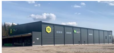
Paimio recycle HUB, Rester and LSJH

Spinnova and Suzano to open commercial scale factory in 2022