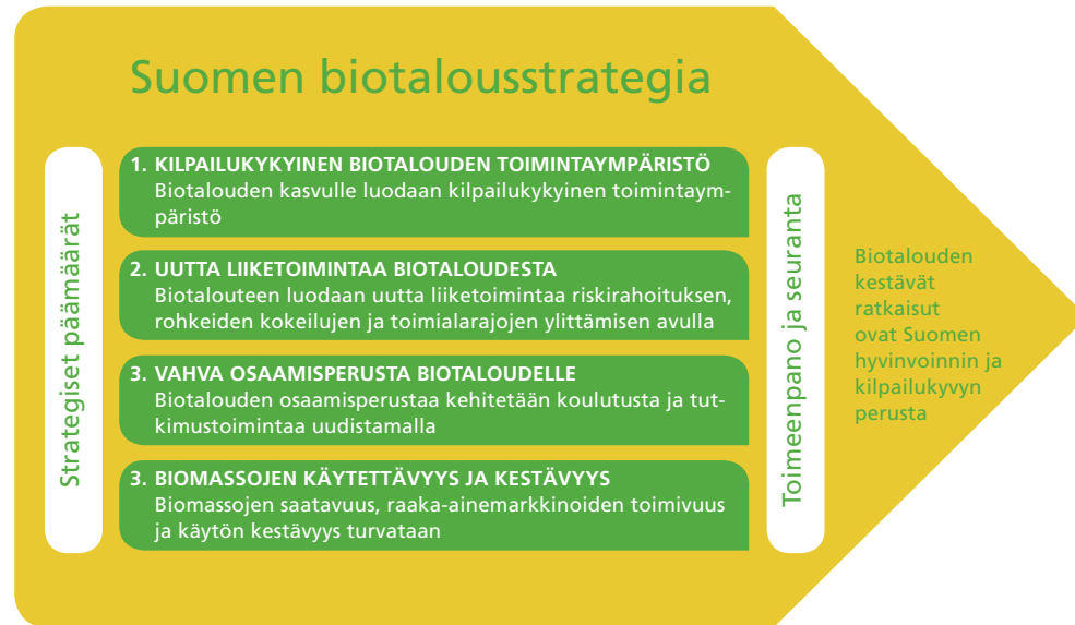
Kuva 2. Biotalousstrategian visio ja strategiset päämäärät

Biotalousstrategian visiota ja strategisia päämääriä voidaan kuvata kokonaisuutena seuraavan kuvan (kuva 2) avulla: